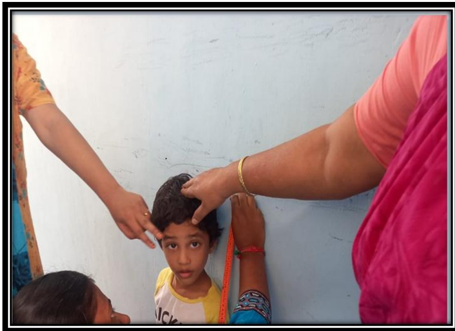
Students involving in anthropometric measurement